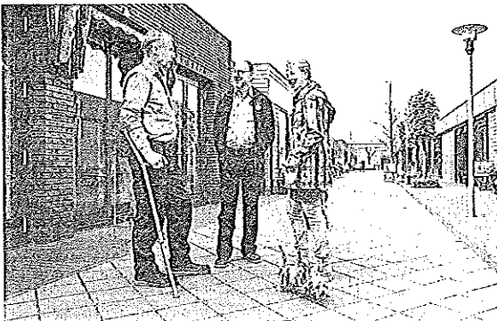
De boulevard loopt in een rondje: je kunt er nooit verdwalen.

avond gehaktballen op het menu. „Ook qua diner houden we rekening met de leefstijl. In de Gooise woning gaat het heel anders: daar serveren we een stukje rundvlees onder dekschalen.” De Gooise en stadse woning zijn sowieso een wereld van verschil. Waar in de 'Jordaan' vrolijk gezongen wordt, heersen in het Gooi rust en stilte, blijkt als we er binnenstappen. Als er al muziek op staat, dan is dat klassieke muziek. De bewoners zitten om de salontafel. Een bank zie je hier niet, want iedereen preferereert zijn eigen fauteuil. De mensen zijn wat meer op zichzelf en de koffie drinken ze uit kop en schotel, in plaats van een mok.