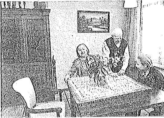
De Indische woning.